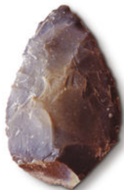
Ominidi e uomini prima di Homo sapiens

Una storia prima della storia. Ossa fossili, denti, manufatti, siti preistorici e dati genetici per ricostruire l'evoluzione di un gruppo di scimmie antropomorfe che, intorno a 6 milioni di anni fa, in Africa, intrapresero l'intricato percorso evolutivo che diede origine alla nostra specie. E' la lunga vicenda raccontata in questo libro: dalle origini, quando primati bipedi popolavano un habitat ancora forestale, alla varietà delle cosiddette "australopitecine" - fra cui la nota Lucy -, all'emergere del genere Homo, fino alla comparsa sulla scena di Homo sapiens e alla sua (nostra) affermazione sull'intero pianeta. Un percorso lungo e complesso, fondamentale per la nostra natura di esseri biologici e, al tempo stesso, culturali. Illustrazioni dell'autore