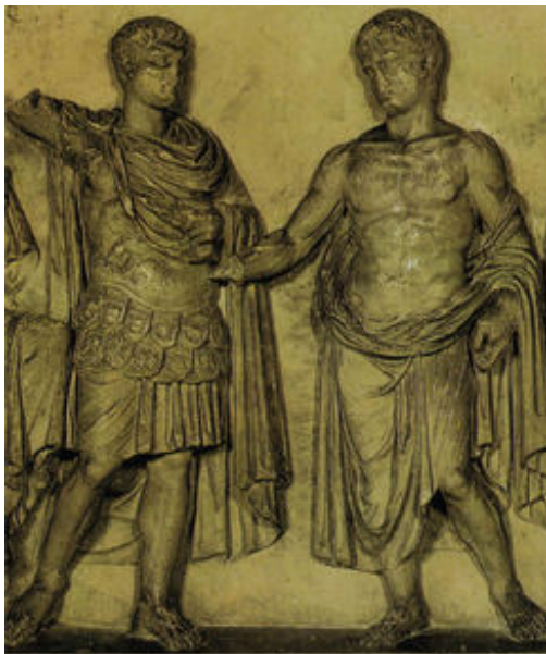
Cicerone Contro Catilina